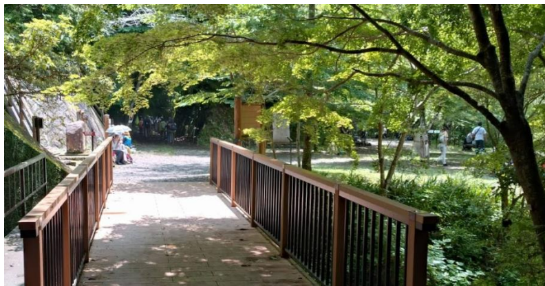
④長尾山第1トンネル