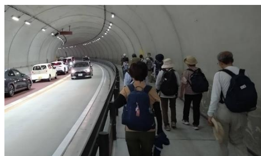
現在のトンネルです