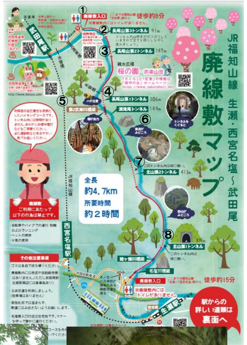
②長尾山第 3 トンネル