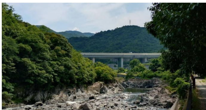
中国自動車道が見えてきました