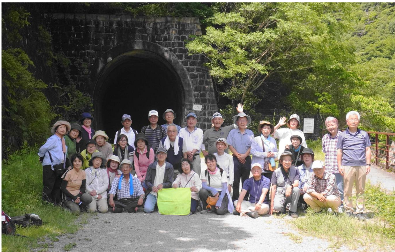
全員が写るように、集合写真の撮り直しです。バッチリですね！