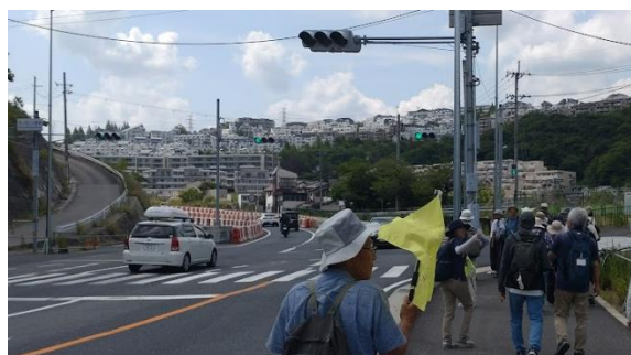
さっきまでの風景が嘘のようです……